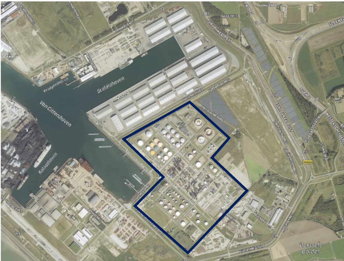
Figuur 3: Ligging Zeeland Refinery in diens omgeving