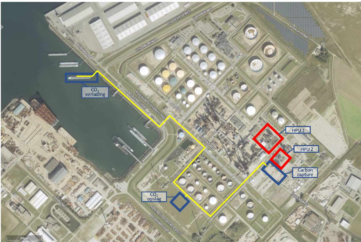
Figuur 4: Indicatieve locaties van de verschillende onderdelen van de voorgenomen activiteit