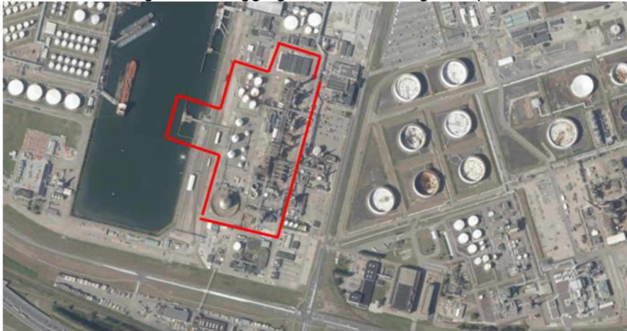
Figuur 0.1: Ligging Shin-Etsu ten opzichte van haar omgeving [bron: Esri, ArcGIS].

In onderstaand figuur is de ligging van de inrichting ten opzichte van haar omgeving opgenomen.